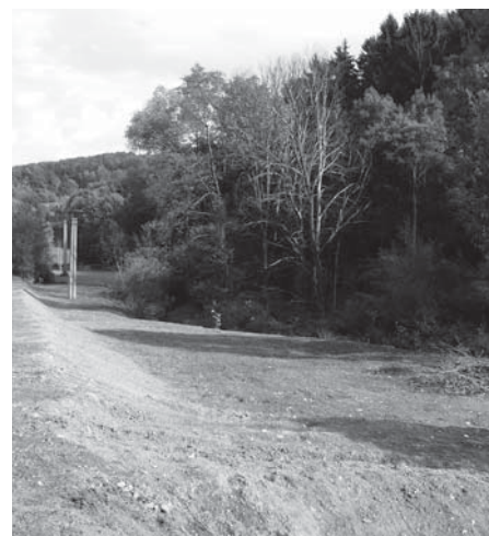
Upravené místo po likvidaci neoprávněné skládky.

• ZO schválilo firmu OPEN terra Vsetín s.r.o. Jiráskova 701, 755 01 Vsetín na dodavatele na odstranění neoprávněného zásahu.