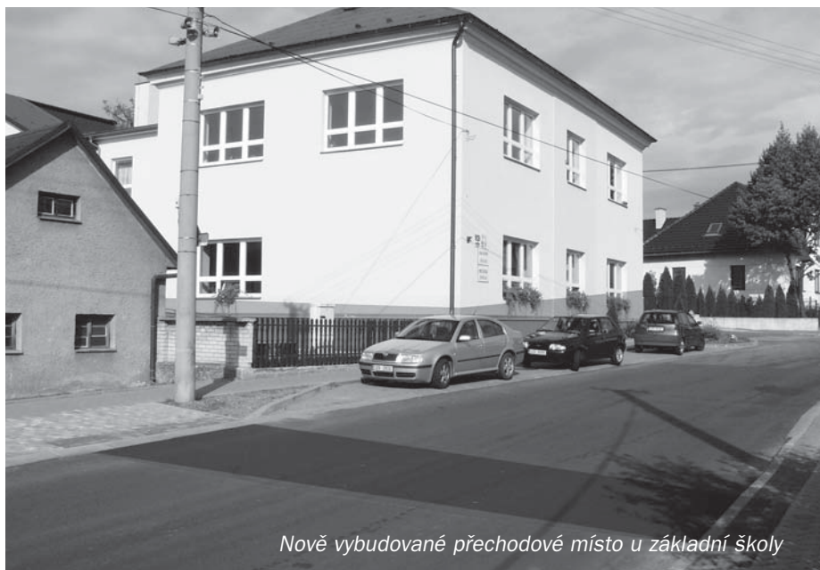
Nově vybudované přechodové místo u základní školy