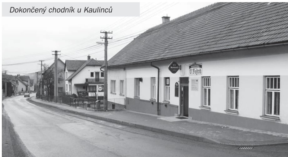
Dokončený chodník u Kaulinců

• ZO schválilo odkup parcel pro plánovanou výstavbu RD a rozvoj obce.