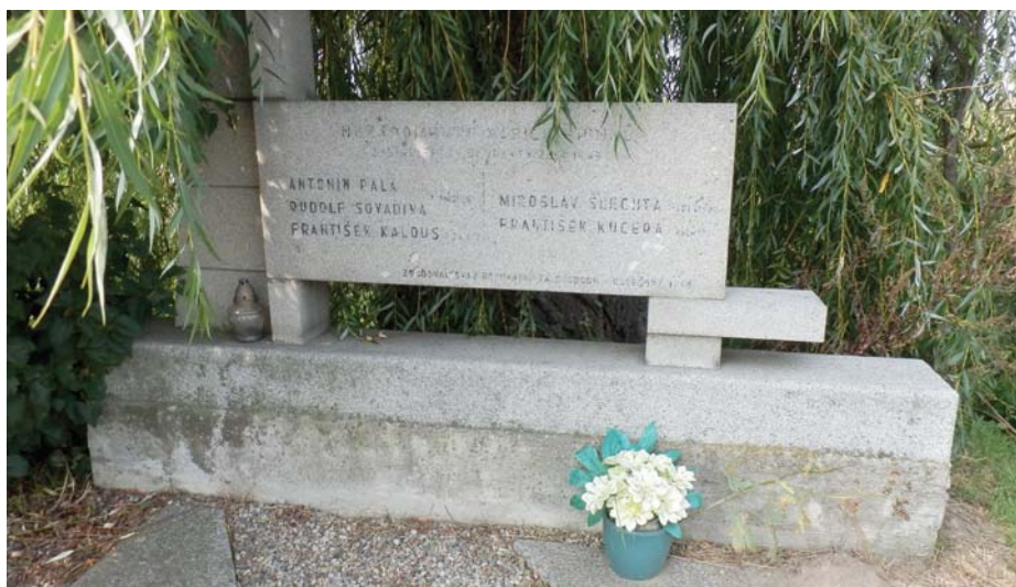
Válečný hrob padlým Třebětice u Holešova

Dne 13. února 1945 přijeli do naší obce příslušníci OT (organisation Todf). Usadili se ve zdejší škole v jedné třídě a kuchyni. Řídili ve Všemíně a v okolí opevňování a zřizování pancéřových překážek. Tyto byly postaveny na Láně a na Hranicích mezi Všemínou a Liptálem. Práce konali všichni mužští obyvatelé obce. Téhož dne se objevili v obci též vojenští ubytovatelé a obsadili zbývajících místností školy pro Wehrmacht. Příštího dne nastěhovali do školy a téměř do všech domů německé vojáky v počtu dvou rot. Asi 300 mužů a 120