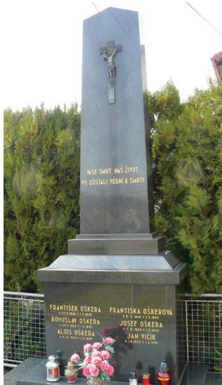
Památník obětem druhé světové války v obci Všemina

Objeveni byli pro spoustu much zahradníkem 15. května 1945. Stolař Lu-