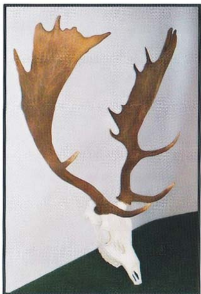
Daněk 21. místo: 161,49 CIC bronz 55 kg - 7 let - 24.10.2016 úhyn Honitba: Všemina